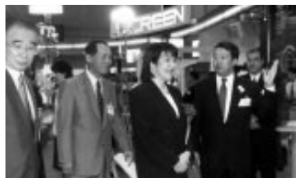
来賓として通産省政務次官高市早苗氏が当社ブースを訪れた

刷機、そして今回開発したA2ワイドサイズの2色デジタル印刷機、A3ワイドサイズの超高速モノクロデジタル印刷機の3機種で、当社のグラフィックアーツビジネスが印刷業界も含めた領域に拡大していることをアピールしました。そのほか、印刷工程の効率化・コスト圧縮を目指したネットワーク分散型印刷システムや広域高速大容量ネットワークサービスも紹介し、未来志向の印刷システムの提案に多くのユーザーから賛同を得ました。