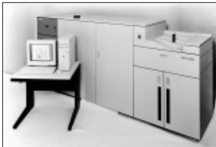
初年度販売台数100台

ビジネス文書やマニュアルなどドキュメント印刷はもちろんのこと、パーソナライズされた印刷情報を発信する「One to One」マーケティングの印刷物や実用化されつつある書籍1冊からの出版などにも最適なオンデマンド印刷の環境を提供します。