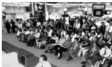
当社の提案に耳を傾ける来場者

9月20日～24日の5日間、東京ビッグサイトで開催された国際グラフィックアーツ総合機材展「IGAS99」は、約18万人もの見学者が訪れ、盛況のうちに幕を閉じました。当社は、CTPレコーダーやデジタル印刷システムなど新製品をラインアップし、多くの来場者で賑わいました。印刷のデジタル化の進展にあいまって特に注目を集めた製品は、昨年リリースしたA3ワイドサイズの4色デジタル印