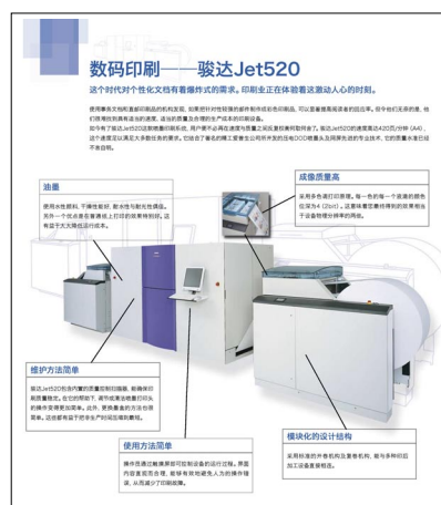
商品目录使用实例