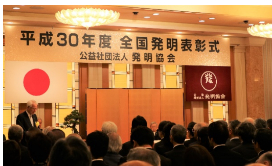
ホテルオークラ東京での表彰式

株式会社SCREENホールディングスではこのたび、公益社団法人 発明協会が主催する「平成30年度全国発明表彰」において、「大面積レジスト塗布装置における異物検出方法の発明（特許第4105613号）」が「発明賞」を受賞しました。