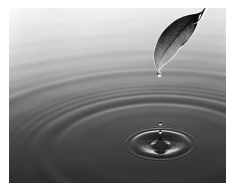
Vol. 131 「水のオブジェ」より